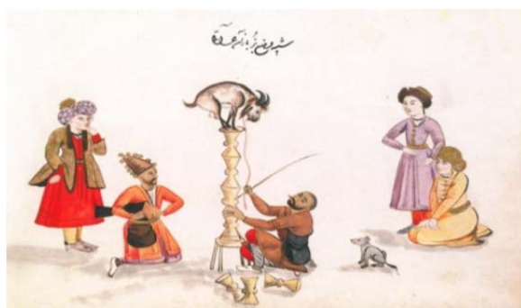
از آلبوم گردآوری‌شده کمپفر (Campfire)، منسوب به جانی فرنگی‌ساز، ۱۰۹۷ق/۱۶۸۵م، موزه بریتانیا

می‌شود. زمان اجرای نمایش تکم گردانی از اواسط اسفند است. در این هنگام، تکم‌چی‌ها و سایاچی‌ها همراه تورباچکن (توبره‌کش) از روستا ره‌سپار شهر می‌شوند یا به چادرهای ایل در قشلاق می‌روند. تکم‌چی‌ها با دردست‌داشتن سینی بزرگی از نقل و نبات و شمع و آینه و تمثال علی (ع) و با کوباندن دو چوب به هم می‌رقصند، تکم می‌گردانند و بشارت آمدن نوروز را می‌دهند (وکیلان، ۱۳۷۹: ۳۶؛ ملاییان، ۱۳۸۷: ۱۰۸)، و صاحب‌خانه نیز نوید تکم‌چی را با صلوات و دادن انعام و هدیه پاسخ می‌دهد (نباتی‌مقدم، ۱۳۸۶).