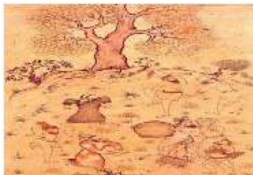
نگاره‌ای از سلطان محمد، ۹۲۶ق/۱۵۱۹م، گالری هنر فریر، واشنگتن

هر گروه از معرکه‌گیران ابزار کار خاص خود را داشت، اما وسایلی بود که همه داشتند؛ مثل شاخ نفیر که برای گردکردن مردم استفاده می‌کردند (ملاح، ۱۳۵۴: ۳۳). در سمک عیار این وسایل برای معرکه‌گیران نام برده شده است: حقه، مهره، طبله، ساز بساط، تخته‌روی، صورت‌های مجوف، دهل آواز، آلت‌های هنگامه‌داری (ارجانی، ۱۳۶۳: ج ۴، ۱۳۷). از وسایل آنان رنگ هم بود، چنان‌که در سمک عیار عالم‌افروز دارویی بر روی خود می‌مالد که سرخ می‌شود؛ بر مثال فرنگی و ریشی بریست سفید (همان). به صحنه معرکه‌گیران بساط می‌گفتند که دایره‌وار و از سفره چرمین بود.