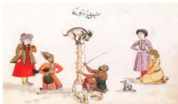
از آلبوم گردآوری شده کمپفر (Campfire)، منسوب به جانی فرنگی ساز، ۱۰۹۷/ق/۱۶۸۵م، موزه بریتانیا

می شود. زمان اجرای نمایش تکم گردانی از اواسط اسفند است. در این هنگام، تکم چی ها و سایاچی ها همراه تورباچکن (توبره کش) از روستا ره سپار شهر می شوند یا به چادرهای ایل در قشلاق می روند. تکم چی ها با دردست داشتن سینی بزرگی از نقل و نبات و شمع و آینه و تمثال علی (ع) و با کوباندن دو چوب به هم می رقصند، تکم می گردانند و بشارت آمدن نوروز را می دهند (وکیلان، ۱۳۷۹: ۳۶؛ ملایان، ۱۳۸۷: ۱۰۸)، و صاحب خانه نیز نوید تکم چی را با صلوات و دادن انعام و هدیه پاسخ می دهد (نباتی مقدم، ۱۳۸۶).