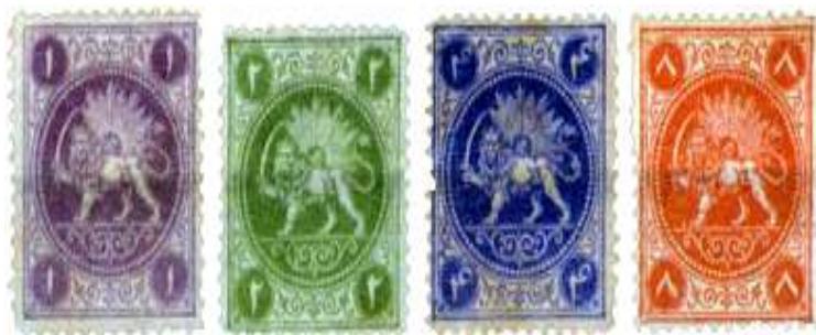
تصویر ۳: نمونه تمبرهای طراحی شده توسط بار (فرح بخش، ۱۳۷۹)

کلیشه‌ها چاپ شدند و نقش تمبر عبارت است از نشان رسمی دولت ایران (شیروخورشید) که درون دایره‌ای قرار داشت و دور شیروخورشید از زنجیره‌ای با ۸۶ دانه مروارید مانند احاطه کرده و برای هر تمبر متعدد فارسی در دوایری که چهارگوشه تمبر قرار گرفته، حک گردیده است. به این ترتیب اولین تمبرهای ایرانی در دوره ناصرالدین‌شاه در داخل کشور چاپ شد. این سری تمبرها به نام سری «باقری» معروف است.