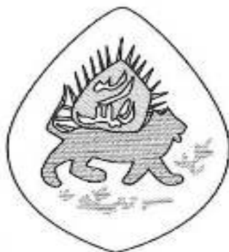
تصویر ۹: مهر شاهنشاهی نادرشاه افشار (رامین، ۱۳۹۰، ۳۰)

تصویر ۸: نگارگری، حمله‌ی مغول به ایران، سده هشتم ه.ق (رامین، ۱۳۹۰، ۳۰) در دوران صفوی و افشاریه نیز پیوسته این نماد بر روی درفش ملی ایران به چشم می‌خورد و آن از دوران شاه‌عباس به صورت نشان اصلی درفش ایران درآمد.