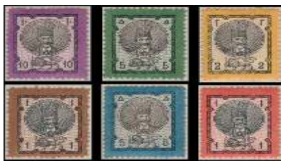
تصویر ۱۲: تمبر سری ناصری دور الوان، ۱۲۵۶ هجری (شیدوش و ابراهیمی، ۱۳۹۰)

شیروخورشید به‌عنوان نقش تمبر ایران کاملاً جا افتاده بود، آن را به‌صورت توأمان و در زیر تصویر شاه بر تمبر چاپ نمودند. پس از آن باز تا سال ۸-۱۲۵۷ شمسی که یک‌بار دیگر این دو نقش به‌صورت توأمان در تمبر سری «دور الوان» ناصری به چاپ رسید، تنها نقش شیروخورشید بر تمبرهای ایران چاپ گردید. (شکل ۱۲)