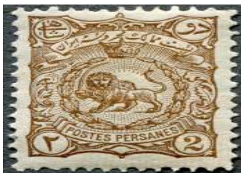
تصویر ۱۰: تمبر شیر و خورشید، سری کاغذ سفید، موزه ملک (۱۲۷۶ ه.ش)