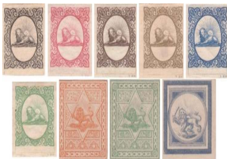
تصویر ۲: نمونه تمبر ریستر (فرح بخش، ۱۳۷۹: ۱۰ و ۹)

سفارش تمبر با وزارت پست و تلگراف فرانسه وارد مذاکره شود. یک طراح فرانسوی به نام ریس تر ۹ که از ورود هیئت نمایندگان ایران و منظور آنان اطلاع حاصل کرده بود نمونه‌هایی از تمبر تهیه و به هیئت نمایندگان ارائه داد. شکل تمبر عبارت بود از شیری خوابیده که خورشید از پشت آن می‌تابد. نقش شیروخورشید در قسمتی بیضی‌شکل و در وسط تمبر دیده می‌شود و اطراف آن را اشکال تزئینی فراگرفته است. در قسمت پائین تمبر فاصله سفیدی گذاشته شده تا بتوان بعداً قیمت را در آن چاپ کرد. این «سری نمونه» ظاهراً شامل ۱۲ عدد تمبر بود که به رنگ‌های مختلف روی کاغذ سفید یا الوان ۱ بدون دندان چاپ شده بود و در همان ایام در پاریس به معرض نمایشی گذاشته شد (زابلی نژاد، ۱۳۸۷: ۲۶). (تصویر ۲)