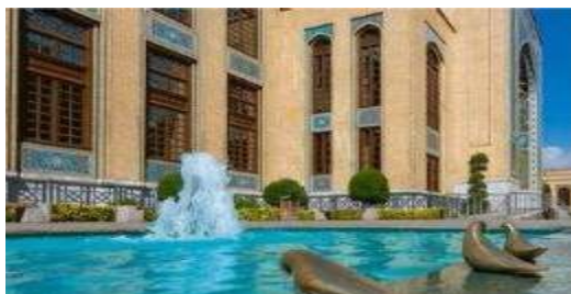
تصویر ۱۴: فضای بیرونی موزه ملک