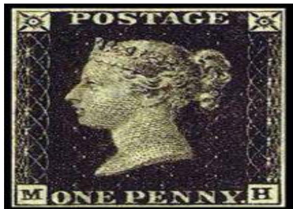
تصویر ۱: اولین تمبر پست در انگلستان معروف به پنی سیاه (نوبین فرح بخش، ۱۳۹۰)

به عبارتی، دوران سلطنت ناصرالدین شاه که مصادف با رقابت شدید دولت‌های بریتانیا و روسیه در ایران بود بر اهمیت ایران زمین به مثابه پل ارتباطی میان شرق و غرب بیش از پیش افزود و این گستره باستانی را مطمح نظر کشورهای اروپایی قرار داد. در آن روزگار شاه جوان که به نوگرایی اهمیت می‌داد، لیک مایل نبود در راه آن ذره‌یی از قدرت خویش بکاهد، رویکردی به انجام اصلاحات را آغاز کرد؛ از جمله اصلاحاتی که مربوط به امور اداری می‌شد که عبارت بود از: ایجاد راه‌های جدید پستی، ایجاد چاپارخانه‌ها، تهیه اوراق دولتی مخصوص با نشان شیروخورشید و به کار بردن تمبر در تشکیلات پستی. به دنبال تصمیم جدی ناصرالدین شاه برای مدون کردن پست ایران، حسنعلی خان امیرنظام گروسی، وزیر مختار ایران در پاریس به علت معاشرت با امپراتور ناپلئون سوم و ارتباط با رجال فرانسوی، به ایران احضار شد و از او خواسته شد تا با کارشناسان وزارت پست و ضرابخانه فرانسه و متخصصان تهیه کلیشه و چاپ تمبر ارتباط برقرار کند تا کلیشه‌یی برای ایجاد نخستین تمبر پستی در ایران تهیه کند (کسری، ۱۳۹۱: ۸). ناصرالدین شاه پیش از این اقدامات در سال ۱۸۵۱م [۲۶۷ ق] در ایران چاپارخانه تأسیس کرده بود و رسمیت و استقرار این مؤسسه برای اطلاع عموم در روزنامه وقایع التفاقیه اعلام شد (ارجمند، ۱۳۷۵، ۳۰۸). «ناصرالدین شاه در سال