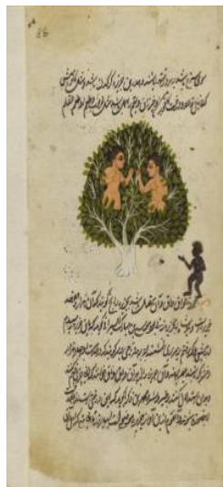
تصاویر ۸ و ۹. ساکنان جزیره واقواق و درخت واقواق. عجایب المخلوقات قزوینی. به خط رکن‌الدین عرف کوجرخان ابن بهادرخان ابن طاهرخان افغان سروانی. هند. ۱۱۰۶ هجری (۱۶۹۵ م).

این تصاویر ساکنان جزیره واقواق و درخت افسانه‌ای آن را نشان می‌دهد. در یکی از صفحات این کتاب (تصویر ۸) افرادی به روی درخت به صورت برهنه و عریان تصویر شده‌اند، همان‌طور که متن نسخه آن‌ها را توصیف می‌کند. در تصویر دیگری از صفحات پایانی کتاب (تصویر ۹) درباره درختی سخن به میان آمده است که توصیف آن چنین است: «درختی است عظیم و ثمر او همچون سر انسان چون شب شود سرها بر زمین بیفتد، روز شود همان جا قایم شوند. چنانچه حیوانی است عظیم سر او چون فیل و پاهای