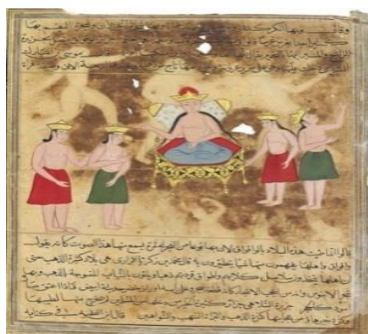
تصویر ۱. ساکنان جزیره الیمنی و جلوس ملکه واقواق. گواش و طلا روی کاغذ. ۲۱×۲۷ سانتیمتر. قرن ۱۵۷۰ میلادی. هند.

۱- نسخه عجایب المخلوقات قزوینی قرن ۱۰ هجری (۱۵۷۰ م): یک نسخه از عجایب المخلوقات قزوینی به دست آمده است که اکنون در دانشگاه کلمبیا (Columbia University Museum) نگهداری می‌شود. این نسخه متعلق به مکتب بیجاپور ۲ بوده و در دکن ۳ مصور شده است (تصویر ۱). متن آن به عربی کتابت شده و نظام صفحه‌آرایی تصویر به این گونه است که متن و تصویر درون کادری با چند