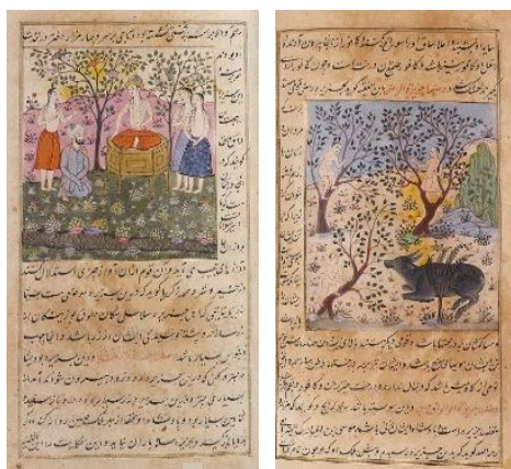
تصاویر ۱۰ و ۱۱. ملکه جزیره واقواق و درخت واق. عجایب المخلوقات قزوینی. آبرنگ مات، طلا، جوهر سیاه و قرمز به روی کاغذ. 34 x 24 Cm. هند. ۱۲۳۸ هجری (۱۸ م).

متن این نسخه به زبان فارسی و با خط زیبای نستعلیق کتابت شده است. ساختار این اثر ترکیبی از متن و تصویر است و طی یک قاعده کلی تمامی صفحات مزین به یک کادر با حاشیه طلایی بوده که متن و تصویر را دربر گرفته است. تکنیک آن جوهر و آبرنگ مات به روی کاغذ کرم رنگ است که در اندازه ۲۴ × ۳۴ سانتیمتر کار شده است. هنرمند یا هنرمندان تصویرگر این نسخه ناشناخته‌اند اما در صفحه پایانی نسخه شخصی به نام ملک وهاب را حامی آن معرفی نموده