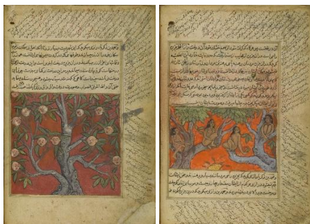
تصاویر ۴ و ۵. ساکنان جزیره واق واق و درخت واقواق. عجایب‌المخلوقات قزوینی. Cm 31 x 21. دوره محمدعادلشاه. ۱۰۶۱ هجری. هند. (۱۶۵۱ م).

است (تصاویر ۴ و ۵). زبان نسخه فارسی و کتابت آن به خط نسخ می‌باشد. تمامی صفحات این نسخه به دو کادر آبی و طلایی مزین شده است که متن و تصویر را دربرمی‌گیرد و ساختار اثر به گونه‌ای است که خارج از کادر اصلی، مطالبی به صورت مورب که شامل پرسش و پاسخ در امور صوفیه، عرفا و ذات خداوند، در حاشیه کاغذ نوشته شده است. هویت هنرمندان تصویرگر این نسخه بر ما پوشیده است. هر دو تصویر، نشان‌دهنده یک واقعه بدون زمان و مکان مشخص هستند از این‌رو فضای حاکم بر آن‌ها دارای خصلتی تصویری است.