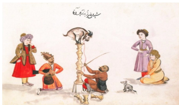
از آلبوم گردآوری‌شده کمپفر (Campfire). منسوب به جانی فرنگی‌ساز، ۱۰۹۷ق/ ۱۶۸۵م، موزه بریتانیا

و هم‌راه او دسته‌ کودکان نیز به رقص درمی‌آیند. پس از آئین بزرقصانی باران می‌بارد. تکم‌گردانی از آئین‌های نمایشی پیشواز نوروز نیز نوعی بزرقصانی است. عنصر اصلی این نمایش عروسک تکم (بز) است که روی صفحه‌ای سخت قرار داده می‌شود و با خواندن ترانه به رقص درمی‌آید. به کسی که تکم را می‌گرداند تکه‌چی گفته می‌شد. عنصر اصلی این نمایش بز است و در برخی از مناطق به جای بز از شتر نیز استفاده می‌شود. زمان اجرای نمایش تکم‌گردانی از اواسط اسفند است. در این هنگام، تکم‌چی‌ها و سایاچی‌ها هم‌راه تورباچکن (توبره‌کش) از روستا ره‌سپار شهر می‌شوند یا به چادرهای ایل در قشلاق می‌روند. تکم‌چی‌ها با در دست داشتن سینی بزرگی از نقل و نبات و شمع و آینه و تمثال علی (ع) و با کوباندن دو چوب به هم می‌رقصند، تکم می‌گرداند و بشارت آمدن نوروز را می‌دهند (وکیلان، ۱۳۷۹: ۳۶؛ ملاییان، ۱۳۸۷: ۱۰۸)، و صاحب‌خانه نیز نوید تکم‌چی را با صلوات و دادن انعام و هدیه پاسخ می‌دهد (نباتی‌مقدم، ۱۳۸۶).