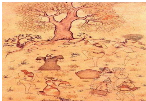
نگاره‌ای از سلطان محمد، ۹۲۶ق/۱۵۱۹م، گالری هنر فریر، واشنگتن

هر گروه از معرکه‌گیران ابزار کار خاص خود را داشت، اما وسایلی بود که همه داشتند؛ مثل شاخ نفیر که برای گرد کردن مردم استفاده می‌کردند (ملاح، ۱۳۵۴: ۳۳). در سمک عیار این وسایل برای معرکه‌گیران نام برده شده است: حقه، مهره، طبله، ساز بساط، تخته‌روی، صورت‌های مجوف، دهل آواز، آلت‌های هنگامه‌داری (ارجانی، ۱۳۶۳: ج ۴، ۱۳۷). از وسایل آنان رنگ هم بود، چنان‌که در سمک عیار عالم‌افروز دارویی بر روی خود می‌مالد که سرخ می‌شود؛ بر مثال فرنگی و ریشی بریست سفید (همان). به صحنه معرکه‌گیران بساط می‌گفتند که دایره‌وار و از سفره چرمین بود.