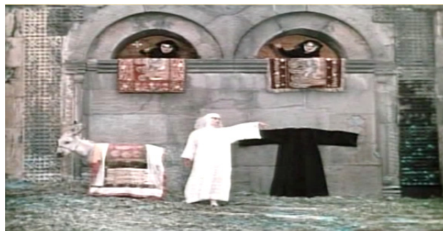
تصویر ۱۰. سکانس زنان در حال آوازخوانی در کنار الاغ (فیلم رنگ انار)