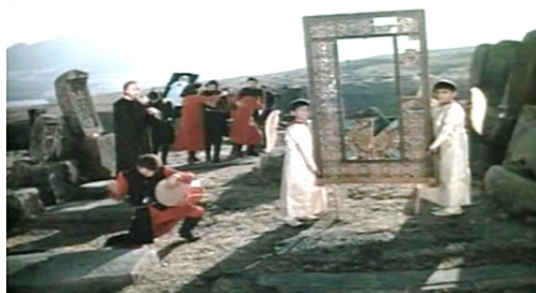
تصویر ۹. مراسم عزاداری در گورستان (فیلم رنگ انار)

می‌آورد (تصویر ۹). صایات نوا، با هدایت آن‌ها، زمزمه می‌کند «زخم‌های من، تازه خون‌ریزی کرده‌اند» و پسران و دختران تکرار می‌کنند. در پایان این سکانس، پاراجانف، با استفاده از همراهی موسیقی و یکی از بهترین شعرهای صایات نوا، به نام «جهان یک پنجره است» برگزاری نوعی آیین و مناسک مذهبی هنگام مرگ را به‌نمایش می‌گذارد (جیمز، ۲۰۱۳: ۱۴۳). به عقیده گرتز، مکانیسم ایجاد کننده ایمان، مناسک (Ritual) است. ایمان مذهبی در جریان مناسک ایجاد می‌شود. مناسک هم مفهوم کلی مذهب را صورت‌بندی می‌کند و هم تکلیف مرجعیتی را مشخص می‌سازد که پذیرش و حتی الزام به پذیرش این مفهوم مذهبی را توجیه می‌کند (همیلتون، ۱۳۷۷: ۲۷۸). در واقع، در مراسم و آیین‌های دینی، که آمیختگی نمادین روحيات معنوی و جهان بینی به وجود می‌آید، آگاهی‌های معنوی مردم شکل می‌گیرد. آیین یا مناسک، یک مفهوم و یک واژه تعیین کننده در اندیشه گرتز است (بختیاری و حسامی، ۱۳۸۲: ۲۳۰-۲۲۹).