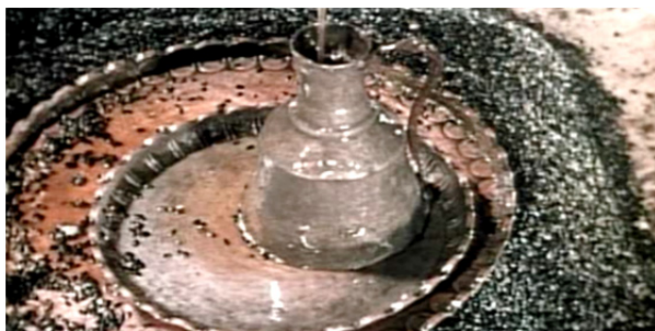
تصویر ۶ روغن گیری از دانه آفتابگردان (فیلم رنگ انار)

فرهنگ قوم ارمن مالیدن روغن مقدس (میورون)، توسط کشیش مذهبی بر صورت فردی است که می‌خواهد گرایش به مسیح پیدا کند. این آیین در زندگی ارمنیان از اهمیتی ویژه برخوردار است. ماده اولیه آیین تدهین، روغن مقدس (میورون به معنای «روغن شیرین») است که از روغن زیتون یا روغن برگ بو تهیه می‌شود. در کار تهیه روغن مقدس بیش از همه از بالزام (مواد معطر صمغی حاوی ترکیبات اتری و خواص مرهمی) استفاده می‌شود و عصاره گل‌های زیادی را هم به کار می‌برند. روغن مقدس معمولاً هر هفت سال یک بار تهیه و تبرک می‌شود و هر بار روغن مقدس جدید را با روغن مقدس قدیمی مخلوط می‌سازند و با دست گریگور لوساوریچ مقدس تبرک می‌کنند. حق تبرک دادن به روغن مقدس در انحصار جاثلیق است (مانوکیان، ۱۳۸۳).