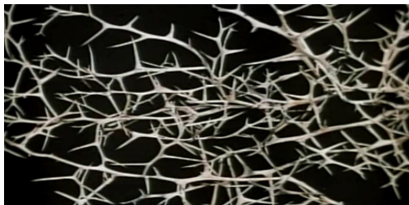
تصویر ۴. خارها در پس زمینه تیره (فیلم رنگ انار)