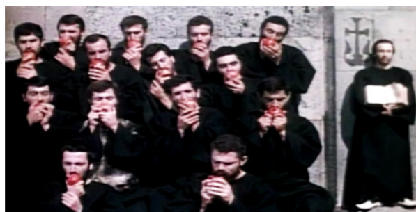
تصویر ۵. خوردن انار توسط راهبان (فیلم رنگ انار)

۵. از نظر عیسویان، صلیب، یکی از اشیای مهم و مقدس، به نشانهٔ مصلوب شدن مسیح و قربانی شدن او برای رستگاری انسان (شفرد، ۱۳۹۳: ۳۴۷) و نماد مرگ و آرزوی زندگی پس از مرگ است (هال، ۱۳۸۰: ۱۵۹). در سکانسی که صایات نوا، با تصویر صلیبی بر پشت سرش و کتاب گشوده‌ای در دستانش، در کناری ایستاده و راهبان همکارش، با سر و صدا، در حال خوردن آب انار هستند (تصویر ۵)، پاراجانف، با کنار هم قراردادن نمادهای مذهبی همچون صلیب و کتاب در یک سوی و نوشیدن آب انار توسط راهبان در سوی دیگر، نمادی از تسلیم در برابر امور نفسانی، و مبارزهٔ بین زهد و نفس اماره را به تصویر می‌کشد (جیمز، ۲۰۱۳: ۱۴۵).