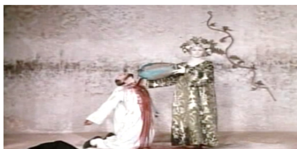
تصویر ۸. ریختن شراب بر روی صایات نوا توسط فرشته قیامت (فیلم رنگ انار)

۸ در هنر عیسوی، برگ تاک، مظهر مسیح و خوشه انگور، نماد شراب در مراسم عشای ربانی، به نشانه خون عیسی مسیح است (هال، ۱۳۸۰: ۲۸۳، ۲۷۸). شراب با خون دیونوسوس (Dionysus)، دو جنسی یونانی، ایزد شهوت، شراب، میگساری و زراعت انگور نیز پیوند دارد (شفرد، ۱۳۹۳: ۲۶۰). به عقیده گیرتز، نمادهای مذهبی، هم موقعیت ما را در جهان بیان می‌کنند و هم به این موقعیت شکل می‌بخشند. این نمادها، از طریق القای تمایلاتی در انسان‌ها، در جهت رفتار کردن به شیوه‌هایی معین و ترغیب حالت‌هایی خاص در آن‌ها، به جهان اجتماعی شکل می‌دهند (همیلتون، ۱۳۷۷: ۲۷۵). در سکانسی، فرشته قیامت، با طرح انتزاعی یک تاک بر روی قبایش و یک جفت تاک بالارونده بر روی دیوار پشت سرش، با ریختن شراب قرمز بر روی سینه شاعر (تصویر ۸) آخرین تجربه دنیایی صایات نوا از لذت‌های دنیوی را نشان می‌دهد (جیمز، ۲۰۱۳: ۱۴۶).