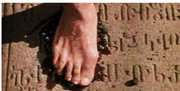
تصویر ۳. پای در حال له کردن انگور بر روی کتیبه ارمنی (فیلم رنگ انار)

۳. در هنر عیسوی، خوشه‌های انگور، نماد شراب در مراسم عشای ربانی و در نتیجه، خون عیسی مسیح است (هال، ۱۳۸۰: ۲۷۸، ۲۸۳). شراب، مملو از معانی کتاب مقدس و سنت ادب فارسی است، که شعرهای صایات نوا، برگرفته از هر دوی آن‌ها است. اما برای قفقازی‌ها شراب ریشه‌های فرهنگی عمیق‌تری دارد. باستان‌شناسی‌های اخیر نشان می‌دهند، قفقاز مکان اولیه تولید شراب بوده است (جیمز، ۲۰۱۳: ۱۳۷). در سکاسی که مردی در حال له کردن انگور بر روی سطح کتیبه ارمنی است (تصویر ۳)، هدف پاراجانف از این دو نماد، تصویر خلاصه شده‌ای از زندگی صایات نوا در صومعه، یعنی ساخت شراب و کنده‌کاری کتیبه‌های سنگی، و نیز استعاره‌ای بصری به معنی «شعر، همانند ساخت شراب از کلمات» است (جیمز، ۲۰۱۳: ۱۳۷). به عقیده گیرتز، نمادهای مقدس، در ایجاد تصویر انسان‌ها از جهان و مرتبط ساختن آن با روحيات‌شان، نقش مهمی بر عهده دارند (همیلتون، ۱۳۷۷: ۲۷۵). پاراجانف نیز به طرز هوشمندانه از انگور به نشانه خون عیسی مسیح به عنوان نقطه طلایی بیانی خود استفاده کرده است.