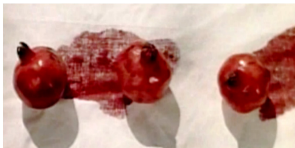
تصویر ۱. سه انار که آبشان به بیرون تراوش کرده است (فیلم رنگ انار)

پاراجانف با نمایش این تصویر، رنج و درد صایات نوا را به‌نمایش می‌گذارد و ریختن آب انار به مفهوم ریختن خون صایات نوا و یا به عبارتی تمثیلی از شهادت وی است.