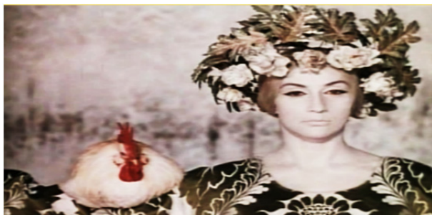
تصویر ۷. خروس بر شانه فرشته قیامت (فیلم رنگ انار)