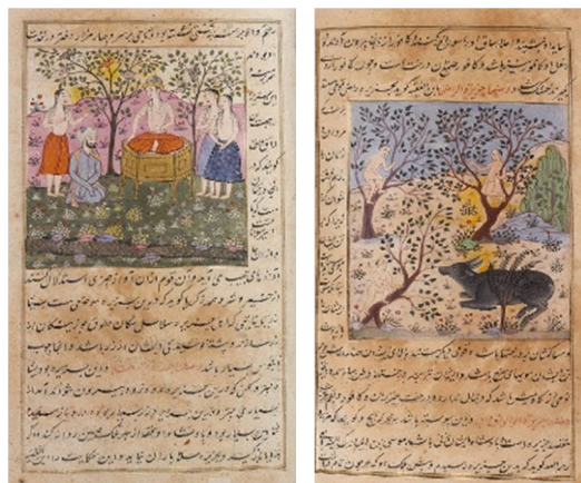
تصاویر ۱۰ و ۱۱. ملکه جزیره واقواق و درخت واق. عجایب المخلوقات قزوینی. آبرنگ مات، طلا، جوهر سیاه و قرمز به روی کاغذ. Cm 34 × 24. هند. ۱۲۳۸ هجری (۱۸ م).