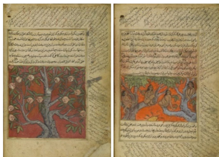
تصاویر ۴ و ۵. ساکنان جزیره واق و درخت واقواق. عجایب المخلوقات قزوینی. 21 × 31 Cm. دوره محمدعادلشاه. ۱۰۶۱ هجری. هند. (۱۶۵۱ م).