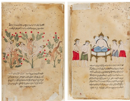
تصاویر ۶ و ۷. ساکنان جزیره رامنی و ملکه آنان و درخت واقواق. عجایب المخلوقات قزوینی. آسیای جنوبی، هند، دکن. ۱۷۰۰. 1/30 \times 2/17 cm. ۱۶۵۰ میلادی.

ترکیب مشخصی از متن و تصویر را نشان می‌دهد که در آن تصاویر در فضایی آزاد و بدون هیچ کادر دربرگیرنده‌ای مابین متن و یا بالای آن قرار گرفته‌اند. این نسخه با تکنیک جوهر، آبرنگ مات و طلا به روی کاغذ و در اندازه 17/2 \times 30/1 سانتیمتر کار شده است.