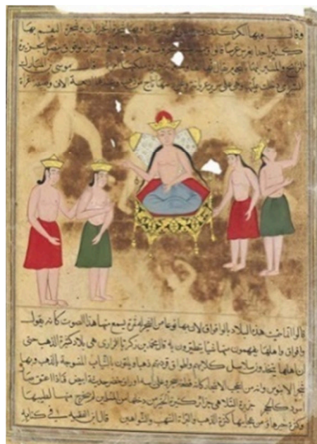
تصویر ۱. ساکنان جزیره الیمنی و جلوس ملکه واقواق. گواش و طلا روی کاغذ. ۲۷×۲۱ سانتیمتر. قرن ۱۵۷۰ میلادی. هند.