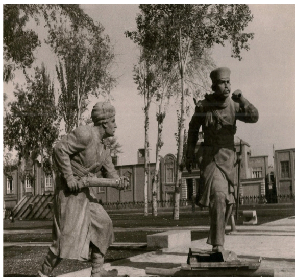
تصویر ۴: سربازان شیپورزن و تفنگدار مجسمه نادرشاه.