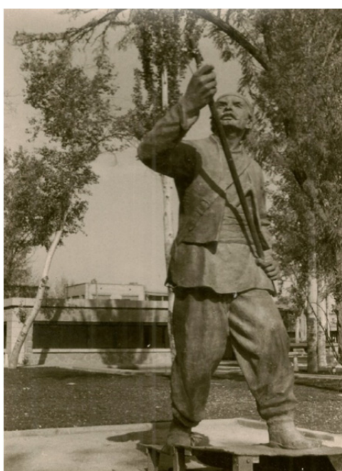
تصویر ۳: سرباز پرچم‌دار مجسمه نادرشاه.

در کار، پذیرفت علاوه بر مبلغ یک میلیون ریالی که قبلاً متعهد به پرداخت به وی شده بود، مبلغ یکصد و بیست هزار ریال دیگر هم در مقابل ساخت ماکت گچی مجسمه، اقامت در ایتالیا و نظارت بر مراحل ساخت و نصب مجسمه اصلی به او پردازد. اما افزایش مبلغ قرارداد کارخانه برونی را غیرمنطقی و غیرعملی دانست و تهدید کرد در صورت اصرار کارخانه بر مبلغ پیشنهادی خود و روشن نبودن تعهدات آن، کار را به کارخانه دیگری واگذار خواهد کرد (همان، اسناد ساماندهی نشده/۱۳۹۸-۱۰).