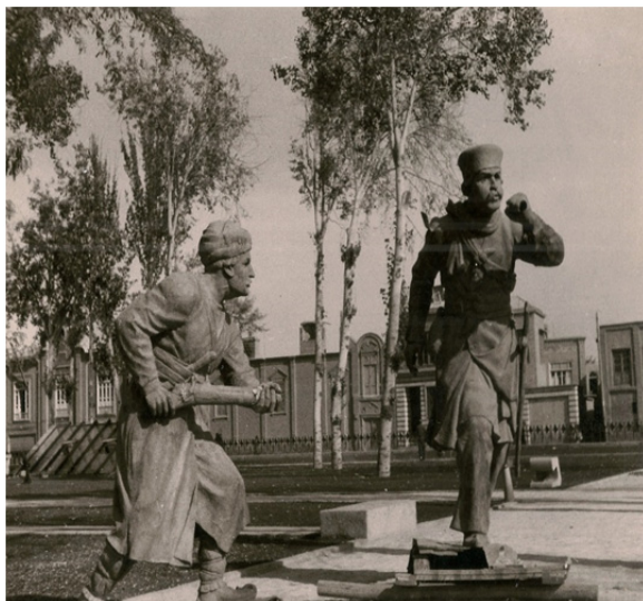
تصویر ۴: سربازان شیپورزن و تفنگدار مجسمه نادرشاه.