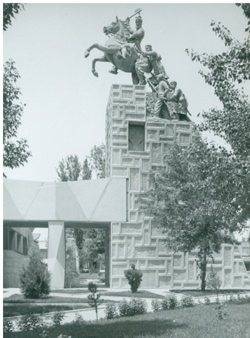
تصویر ۵: کروپ مجسمه نادرشاه.