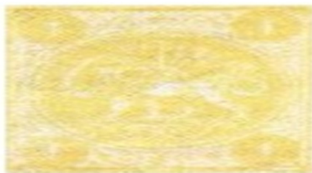
تصویر ۱۶: عنوان تمبرهای دوره قاجار «یک قران زرد»، تاریخ انتشار: ۱۲۵۴ (ابراهیمی، ۱۳۹۴)

سری اول تمبرهای ایرانی سری تمبرهای باقری می‌باشد. تمبر اول ایران یک شاهی است که در چهار گوشه تمبر عدد یک نمایان بوده، تمبر دارای طرح شیر و خورشید می‌باشد و تمبرها بدون دندانه هستند. تمبرهایی بدین شکل و ترتیب هشت عدد می‌باشند که ۱، ۲، ۴، ۸ شاهی و تمبرهای ۱، ۲، ۴، ۸ شاهی با مهر یکصد عدد که حرف صد به شکل مخصوص: ۱ نوشته شده است در تمبر ۴ شاهی با مهر یکصد عدد سری باقری عدد صد بشکل ۱: چاپ شده است و طرح کلیه تمبرها شبیه هم می‌باشد و فقط در رنگ با هم تفاوت دارند. این تمبرها که اولین سری رسمی تمبرهای شیر و خورشیدی ایران هستند در بلوک‌های چهارتایی بدون دندانه و با تنوع در کاغذ و رنگ چاپ شده‌اند. مهر خورده تمبرهای فوق به دلیل عدم وجود مهر ابطال در آن زمان موجود نمی‌باشد. تمبرهای با حاشیه زیاد و آنهایی که بروی کاغذهای خیلی نازک و یا خیلی کلفت چاپ شده‌اند، ارزش بیشتری دارند. حاشیه این تمبرها نقوش گیاهی با طرح اسلیمی استفاده شده است. سری دوم تمبرهای ایرانی حروف به سری کاردی می‌باشد که همانند سری اول می‌باشند با این تفاوت که برای اولین بار در ایران تمبرهای دندانه دار چاپ شد. سال انتشار این سری تمبرها ۱۲۵۴ می‌باشد. (ابراهیمی، ۱۳۹۴).