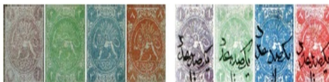
تصویر ۱۵: عنوان تمبرهای دوره قاجار « سری باقری شیر و خورشید و حاشیه نقوش گیاهی» تاریخ انتشار: ۱۲۴۸ (ابراهیمی، ۱۳۹۴)