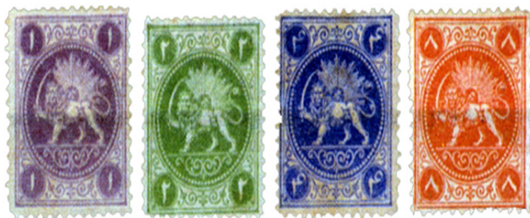
تصویر ۳: نمونه تمبرهای طراحی شده توسط بار (فرح بخش، ۱۳۷۹)

عبارت است از نشان رسمی دولت ایران (شیروخورشید) که درون دایره‌ای قرار داشت و دور شیروخورشید از زنجیره‌ای با ۸۶ دانه مروارید مانند احاطه کرده و برای هر تمبر متعدد فارسی در دوایری که چهارگوشه تمبر قرار گرفته، حک گردیده است. به این ترتیب اولین تمبرهای ایرانی در دوره ناصرالدین‌شاه در داخل کشور چاپ شد. این سری تمبرها به نام سری «باقری» معروف است.