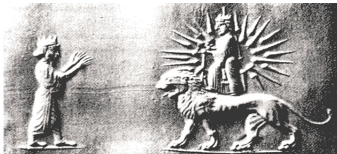
تصویر ۴: خشایارشا (یا اردشیر دوم) در حال نیایش و ستایش «آناهیتا» که سوار بر شیر است، سده چهارم ق.م، موزه ی آرمیتاژ، لنینگراد

این نگاره شاه را در حالت احترام به شیری نشان می‌دهد که زنی بر روی آن جلوس کرده و بارقه‌هایی از نور (آنچنان که در روزگار ما هم قدسین را نمایش می‌دهند) وی را در بردارد. برخی مورخین بر این باورند که در این تصویر شیر نماد «میترا» و خورشید (زنی که بر پشت شیر سوار است) نماد الهه «آناهیتا» است. در کتاب «راهنمای نشان‌ها» ۴ که توسط «آکادمی جهانی نشان‌ها» ۵ به چاپ رسیده است، زمان و تاریخ پدید آمدن نقش «شیر و خورشید» ایران را سده سیزدهم ترسایی ۶ (۷۰۰ سال پیش) بیان کرده است.