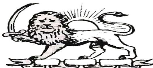
شکل ۵: پیوندی از یک شیر و خورشید، سده سیزدهم ترسایی (۷۰۰ سال پیش) (رامین، ۱۳۹۰، ۱۶)

این نگاره شاه را در حالت احترام به شیری نشان می‌دهد که زنی بر روی آن جلوس کرده و بارقه‌هایی از نور (آنچنان که در روزگار ما هم قدسین را نمایش می‌دهند) وی را در بردارد. برخی مورخین بر این باورند که در این تصویر شیر نماد «میترا» و خورشید (زنی که بر پشت شیر سوار است) نماد الهه «آناهیتا» است. در کتاب «راهنمای نشان‌ها» ۴ که توسط «آکادمی جهانی نشان‌ها» ۵ به چاپ رسیده است، زمان و تاریخ پدید آمدن نقش «شیر و خورشید» ایران را سده سیزدهم ترسایی ۶ (۷۰۰ سال پیش) بیان کرده است.