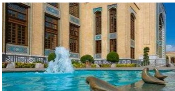
تصویر ۱۴: فضای بیرونی موزه ملی

کتابخانه و موزه ملی ملک تا سال ۱۳۷۵ در خانه ملک برپا بود. اما حاج حسین از آغاز کار، گسترش آن را از نظر دور نداشت و بنای ساختمانی بزرگ تر را پیش بینی کرد. بنابراین در ۲۹ تیرماه ۱۳۲۳ قطعه زمین بزرگی را در باغ ملی تهران (محل کنونی مؤسسه) برای ساختمان جدید کتابخانه و موزه وقف کرد. احداث ساختمان جدید در زمان حیات حاج حسین ملک ممکن نشد. تا این که آستان قدس رضوی طراحی و بنای ساختمان جدید را در سال ۱۳۶۴ آغاز کرد و در ۱۳۷۵ به پایان برد. از نظر ساختار تشکیلاتی، مؤسسه کتابخانه و موزه ملی ملک مؤسسه‌ای غیر دولتی و غیرانتفاعی است که همچون سایر مؤسسات فرهنگی آستان قدس رضوی بر اساس وقف‌نامه زیر نظر مستقیم تولید آستان قدس رضوی اداره می‌شود. ارکان مؤسسه عبارت‌اند از: مجمع عمومی، ناظر استصوابی، هیأت مدیره، مدیرعامل و بازرس قانونی.