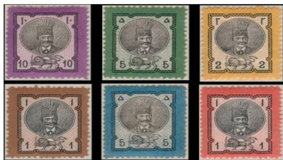
تصویر ۱۲: تمبر سری ناصری دور الوان، ۱۲۵۶ هجری (شیدوش و ابراهیمی، ۱۳۹۰)

نگاهی به جایگاه دو نقش شیروخورشید و شاه در دو تمبر فوق‌الذکر به‌خوبی گویای سلطنت مطلقه ایران و برتری شاه بر نشان دولتی کشور است. پس از این، دو نقش مذکور از هم جدا شده و غالباً در چاپ هر سری تمبر یک یا حداکثر دو نقش شاهی و یک نقش شیر و خورشیدی در کنار هم ولی به‌طور مجزا به چاپ می‌رسید. در سال ۱۲۷۳ شمسی در سری «ناصری بزرگ» یک تاج بالای سر شیروخورشید افزوده شد تا باز بیش‌ازپیش به ارجحیت شاه و سلطنت بر دولت و مردم ایران تأکید شود. از این تاریخ، به‌جز در مورد استثنایی پنجاه قرانی سری «محمدعلی‌شاه» که به شکل بی‌سابقه‌ای شیروخورشید بر فراز تاج شاهی قرار گرفت، وجود تاج بر بالای نقش شیروخورشید جزء انفکاک‌ناپذیر این نقش گردید (رامی، ۱۳۸۶: ۶۰ و ۶۱).