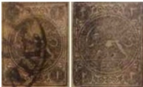
تصویر ۱۷ و ۱۸: عنوان تمبرهای دوره قاجار «یک شاهی و دو شاهی سیاه خاکستری»، تاریخ انتشار: ۱۲۵۵ (ابراهیمی، ۱۳۹۴)

تحلیل آیکونوگرافی ... (سمیه رسولی ابراهیمی فرد و خشایار قاضی زاده) ۱۸۹