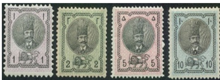
تصویر ۱۱: تمبر سری ناصری چهار جور، ۱۲۵۵ هجری (شیدوش و ابراهیمی، ۱۳۹۰)

جا گرفته بود و در گوشه‌های تمبر، قیمت آن به فارسی ثبت شده بود (ن.ک: تمبرهای ریستر). در واقع می‌توان این‌گونه عنوان کرد که نقش شیر و خورشیدی تمبرهای ایران که تا سال ۱۲۵۵ شمسی یعنی تاریخ چاپ اولین سری تصویر ناصرالدین شاه به نام «ناصری چهار جور» تنها نقش تمبر ایران است (نصری، ۱۳۹۱: ۱۸).