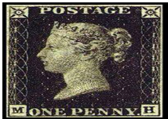
تصویر ۱: اولین تمبر پست در انگلستان معروف به پنی سیاه (نوین فرح بخش، ۱۳۹۰)

اواسط قرن ۱۳ هـ ق روابط میان دربار قاجار و سرزمین‌های خارجی به شکل قابل توجهی فزونی یافت. ناصرالدین شاه نخستین پادشاه ایرانی است که به اروپا سفر کرده است و در بازگشت از سفر اروپا دانش گسترده‌ای از جهان کسب کرده و بسیاری چیزهای جدید را با خود به همراه آورد. (زابلی نژاد، ۱۳۸۷: ۱۰۰).