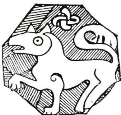
تصویر ۷: نقش شیر بر روی بشقاب لعابی، ری (یک هزار سال پیش) (رامین، ۱۳۹۰، ۲۰)

در شهرری بشقابی لعابی مکشوف شده است که مربوط به سده چهارم هجری قمری (یک هزار سال پیش) است و شیری را نشان می‌دهد. دُم شیر به شکل (S) است و دست راستش را نیز از زمین بلند کرده است و خورشید گونه‌ای نیز بالای سرش قرار دارد. این تصویر از جمله آثاری است که یادآور نقش شیروخورشید امروزی است