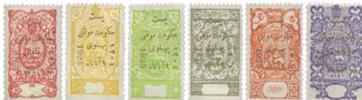
تصویر ۱۹: عنوان تمبرهای دوره پهلوی اول «پست حکومت موقتی پهلوی»، تاریخ انتشار: ۱۳۰۴ (ابراهیمی، ۱۳۹۴)

پهلوی اول: شیر و خورشید و حاشیه نقوش گیاهی