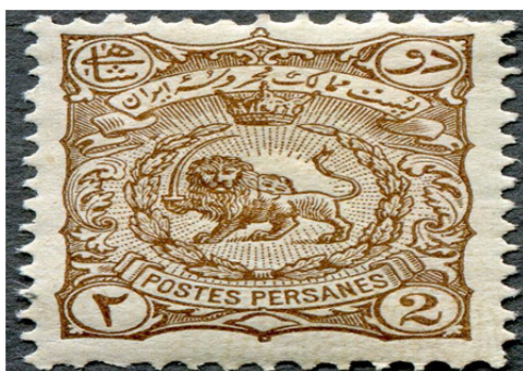
تصویر ۱۰: تمبر شیر و خورشید، سری کاغذ سفید، موزه ملک (۱۲۷۶ ه.ش) (شیدوش و ابراهیمی، ۱۳۹۰)