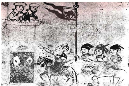
تصویر ۸: نگارگری، حمله‌ی مغول به ایران، سده هشتم ه.ق (رامین، ۱۳۹۰، ۳۰)

از نماد شیروخورشید در ادوار مختلف بر روی درفش نیز استفاده شده است؛ از گفته‌های مورخین چنان برمی‌آید که پس از اسلام اولین بار در دوران سلطان مسعود غزنوی شیر بر روی پرچم ایران آمد که عده‌ای علت را علاقه شاه به شکار شیر دانسته‌اند و پس از او و در دوره‌های بعد این نشان به کرات بر روی پرچم تکرار شد؛ اما قدیمی‌ترین پرچم شیروخورشید دار شناخته شده به سال ۸۲۶ هجری قمری (حدود ۱۴۲۳ میلادی) هم‌زمان با دوره تیموریان برمی‌گردد. این پرچم در مینیاتوری از شاهنامه شمس‌الدین کاشانی (منظومه‌ای درباره جهانگشایی مغولان) به تصویر کشیده شده است. این مینیاتور که حمله مغولان به حصار شهر نیشابور را نشان می‌دهد. سربازان (مغول) را نشان می‌دهد که پرچمی مزین به نشان شیروخورشید در کنار پرچمی دیگر مزین به هلال ماه حمل می‌کنند.