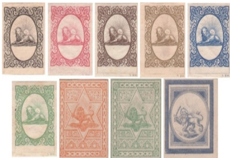
تصویر ۲: نمونه تمبر ریستر (فرح بخش، ۱۳۷۹: ۱۰ و ۹)

تا برای مطالعه و سفارش تمبر با وزارت پست و تلگراف فرانسه وارد مذاکره شود. یک طراح فرانسوی به نام ریس تر (A. M. Rister) که از ورود هیئت نمایندگان ایران و منظور آنان اطلاع حاصل کرده بود نمونه‌هایی از تمبر تهیه و به هیئت نمایندگان ارائه داد. شکل تمبر عبارت بود از شیری خوابیده که خورشید از پشت آن می‌تابد. نقش شیروخورشید در قسمتی بیضی‌شکل و در وسط تمبر دیده می‌شود و اطراف آن را اشکال تزئینی فراگرفته است. در قسمت پائین تمبر فاصله سفیدی گذاشته‌شده تا بتوان بعداً قیمت را در آن چاپ کرد. این «سری نمونه» ظاهراً شامل ۱۲ عدد تمبر بود که به رنگ‌های مختلف روی کاغذ سفید یا الوان، بدون دندانه چاپ شده بود و در همان ایام در پاریس به معرض نمایشی گذاشته شد (زابلی نژاد، ۱۳۸۷: ۲۶). (تصویر ۲)