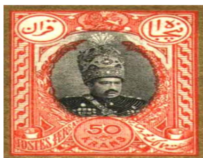
تصویر ۱۳: تمبر پنجاه قرانی سری محمد علی شاه، ۱۲۸۵ ه.ش (رامی، ۱۳۸۶)

نگاهی به جایگاه دو نقش شیروخورشید و شاه در دو تمبر فوق‌الذکر به‌خوبی گویای سلطنت مطلقه ایران و برتری شاه بر نشان دولتی کشور است. پس از این، دو نقش مذکور از هم جدا شده و غالباً در چاپ هر سری تمبر یک یا حداکثر دو نقش شاهی و یک نقش شیر و خورشیدی در کنار هم ولی به‌طور مجزا به چاپ می‌رسید. در سال ۱۲۷۳ شمسی در سری «ناصری بزرگ» یک تاج بالای سر شیروخورشید افزوده شد تا باز بیش‌ازپیش به ارجحیت شاه و سلطنت بر دولت و مردم ایران تأکید شود. از این تاریخ، به‌جز در مورد استثنایی پنجاه قرانی سری «محمدعلی‌شاه» که به شکل بی‌سابقه‌ای شیروخورشید بر فراز تاج شاهی قرار گرفت، وجود تاج بر بالای نقش شیروخورشید جزء انفکاک‌ناپذیر این نقش گردید (رامی، ۱۳۸۶: ۶۰ و ۶۱).