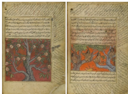
تصاویر ۴ و ۵. ساکنان جزیره واق واق و درخت واقواق. عجایب‌المخلوقات قزوینی. 21 × 31 Cm. دوره محمد عادلشاه. ۱۰۶۱ هجری. هند. (۱۶۵۱ م).

نسخه دیگری از عجایب‌المخلوقات قزوینی موجود در موزه بریتانیا (British Museum) در دوره محمد عادل شاه ۵ ، حاکم بیجاپور به تصویر درآمده است که دارای تصاویر بسیار زیبایی است (تصاویر ۴ و ۵).