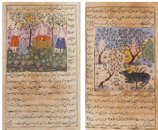
تصاویر ۱۰ و ۱۱. ملکه جزیره واقواق و درخت واق. عجایب المخلوقات قزوینی. آبرنگ مات، طلا، جوهر سیاه و قرمز به روی کاغذ. 24 × 34 Cm. هند. ۱۲۳۸ هجری (۱۸ م).