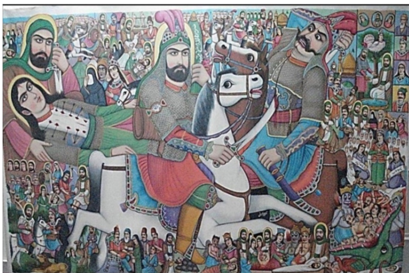
تصویر ۳. پرده درویشی به قلم محمد فراهانی، برگرفته از (عسگری، ۱۳۸۶: ضمیمه)