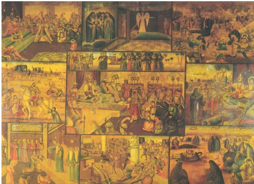
تصویر ۲. روز محشر، رنگ و روغن روی بوم، بدون رقم، منسوب به محمد مدیر، بدون تاریخ، مجموعه موزه رضا عباسی.