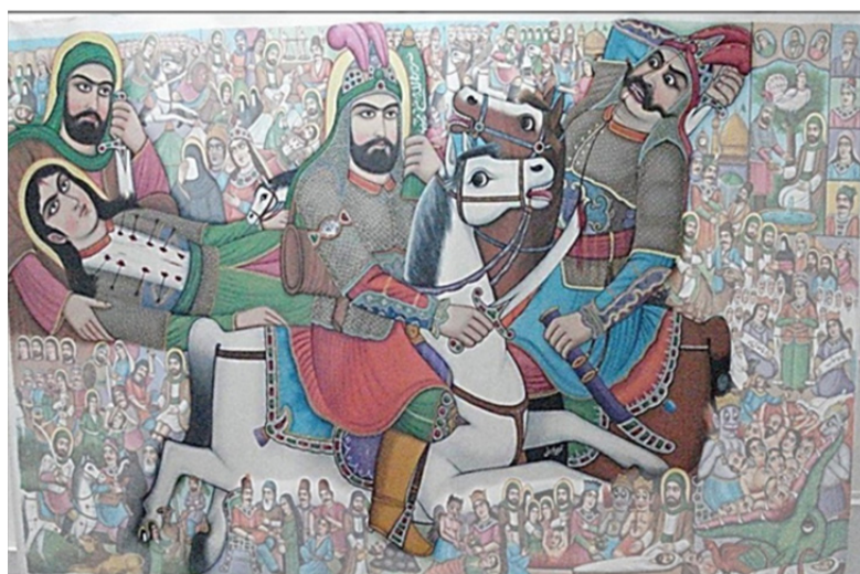
تصویر ۵. مجلس ماردین سدیف و مجلس شهادت علی اکبر (ع)

متفاوت این فرصت را برای پرده‌خوان و مخاطبانشان فراهم کردند تا پرده‌خوان بتواند امکان نقل مجالس پرشماری را در فضای باز داشته باشد (تصویر شماره ۳)